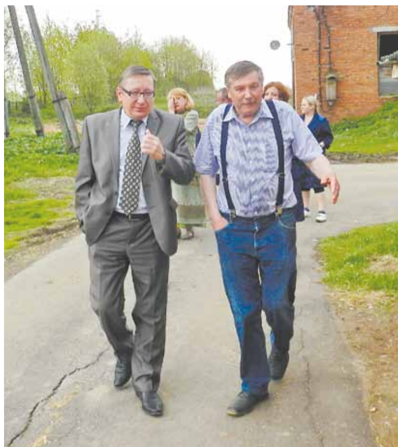
Знакомство с хозяйством

Ярославский район расположен на востоке центральной части Ярославской области, его площадь 1936,7 км 2 (11-е место среди муниципальных районов области). Территория ЯАР окружает территорию городского округа Ярославль, в котором расположен административный центр района.