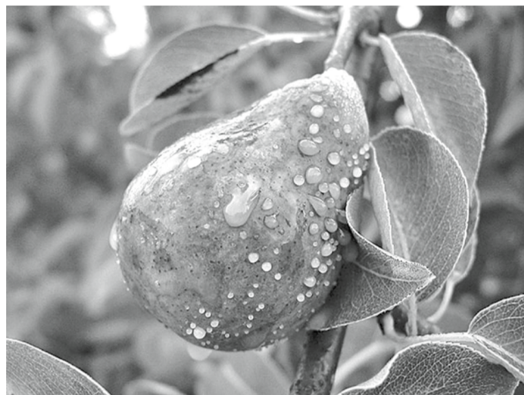
Экссудат на плоде груши

На листьях образуются некротические пятна от края листовой пластинки, позже листья и черешки чернеют и скручиваются. Пораженные плоды приобретают коричневую окраску, увядают и остаются на растении в мумифицированном состоянии. На них могут также появляться капельки экссудата. На скелетных ветвях и стволе появляются темно-коричневые водянистые пятна с нечеткой границей между пораженной и здоровой тканью. В этих местах кора набухает, отслаивается от древесины и может растрескиваться. Позже на границе больной и здоровой ткани образуются трещины, а затем клиновидные язвы. Ткани в зоне язвы красно-бурые или коричневые. Под корой ветвей часто