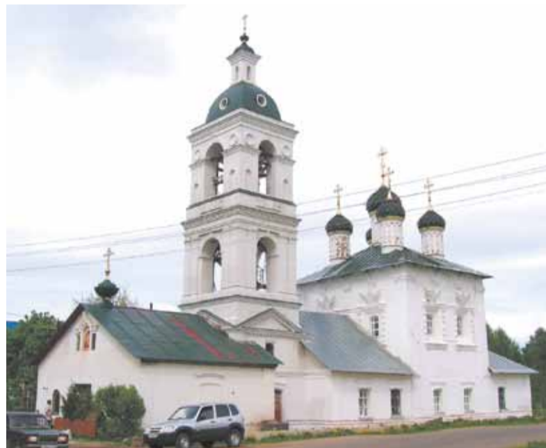
Казанский храм села Сарафоново

Ярославский район расположен на востоке центральной части Ярославской области, его площадь 1936,7 км 2 (11-е место среди муниципальных районов области). Территория ЯАР окружает территорию городского округа Ярославль, в котором расположен административный центр района.