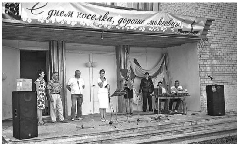
Коллектив Мокеевского дома культуры

Тепло мокеевцы встретили ярославский ансамбль восточного танца «Изадора» (ДК «Судостроитель») и вокальное трио «Контраст» Леснополянского дома культуры. Кульминацией праздника стало выступление творческих коллективов местного Дома культуры.