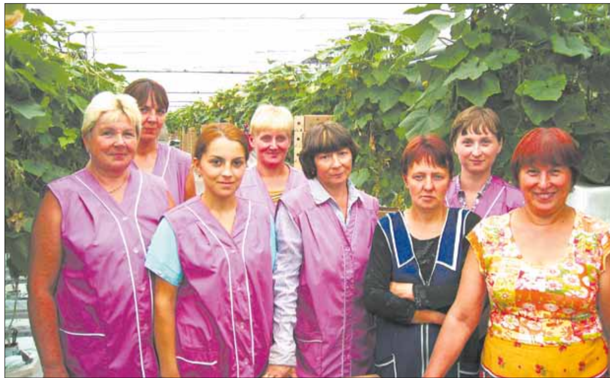
ООО «Дубки». Звено теплицы № 2

Тепличные комплексы зачастую находятся в тени хозяйств открытого грунта. Но проблемы у них схожие и работают тепличники на совесть, внося значительный вклад в сельскохозяйственное производство. В этом мы убедились, побывав в поселке Дубки.