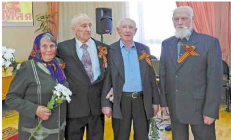
Они приближали Победу

Ярославский уезд образован согласно указу Екатерины II от 3 августа 1777 года. 10 июня 1929 года его сменил Ярославский район. 1 января 1932 года он был ликвидирован, однако уже 20 июня 1933 года восстановлен. Было время, когда отдельно существовали Курбский район (1944-1957 гг.) и Давыдовский (Толбухинский) район (1946-1957 гг.). В 1987 году к Ярославскому району была присоединена часть Некрасовского района (Точищенский сельсовет и село Красное с окрестностями).