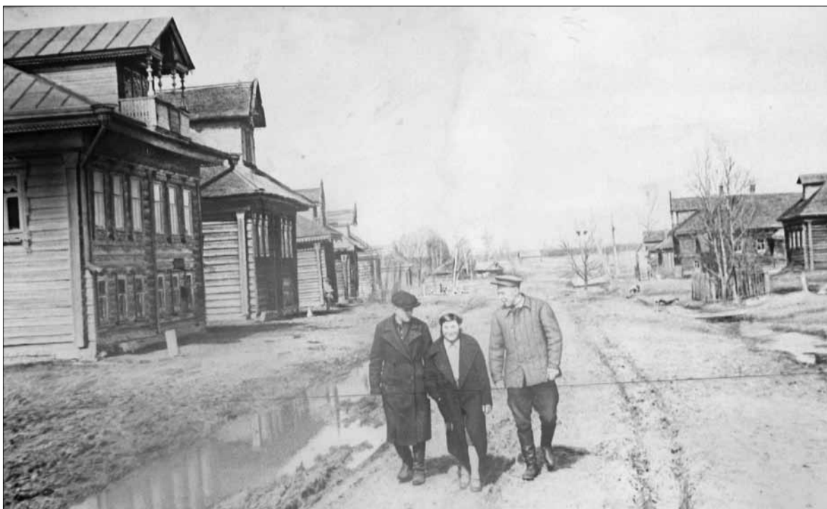
▲ Андроники. 30-е годы XX века. Дом маршала Толбухина (слева на фото).

День вечереет, небо опустело. Гул молотилки слышен в гумне... Я вижу, слышу, счастливы. Все во мне.