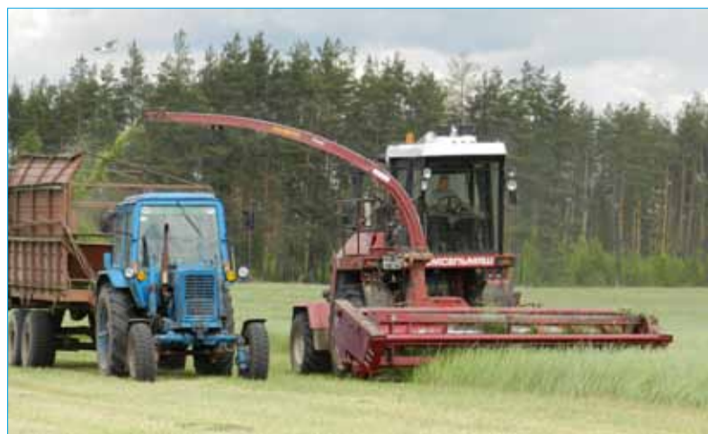
▲ Косьба трав на силос в ЗАО «Агрокомбинат «Заволжский»

В хозяйствах района с каждым днем прибывает количество зеленой массы на силос и готового сенажа. Кроме того, начался сенокос.